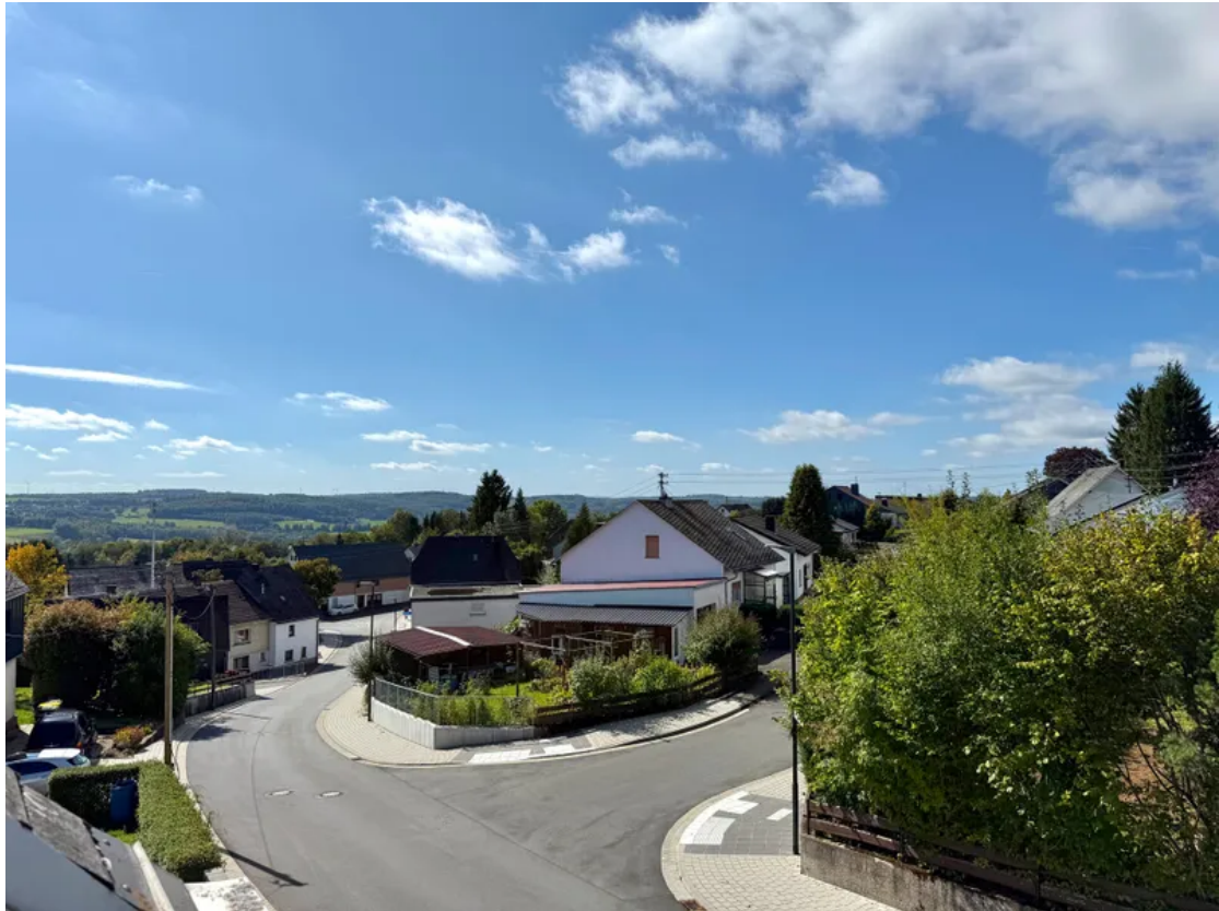
Fernblick von Loggia DG