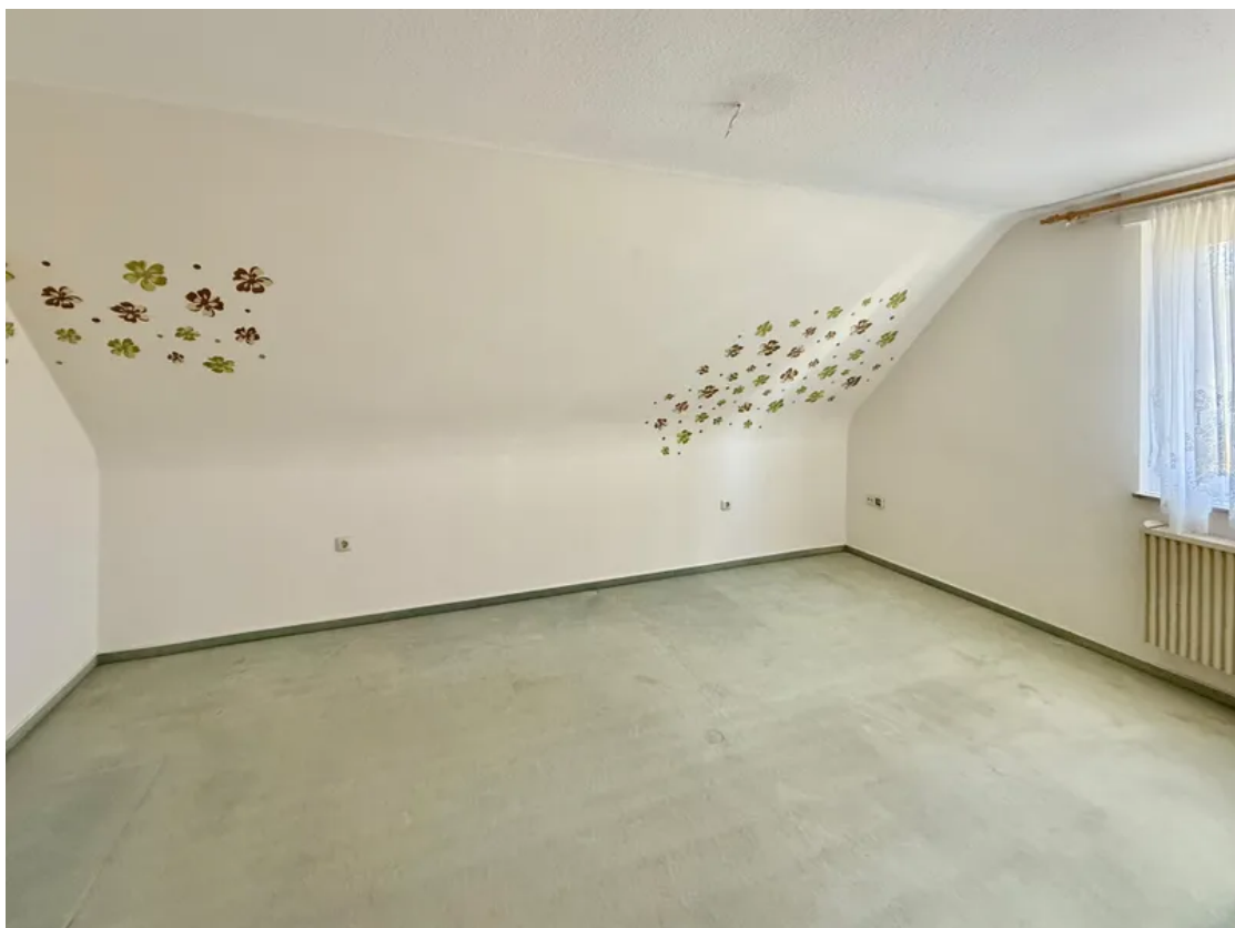
Schlafzimmer 1 DG