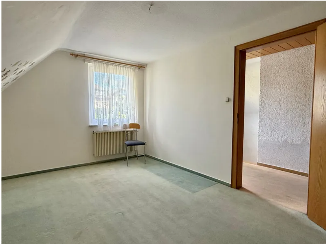
Schlafzimmer 1 DG