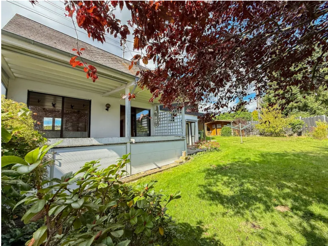
Große, überdachte Terrasse