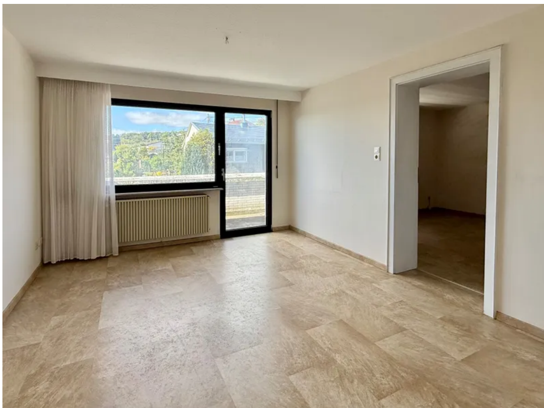
Schlafzimmer 2 DG