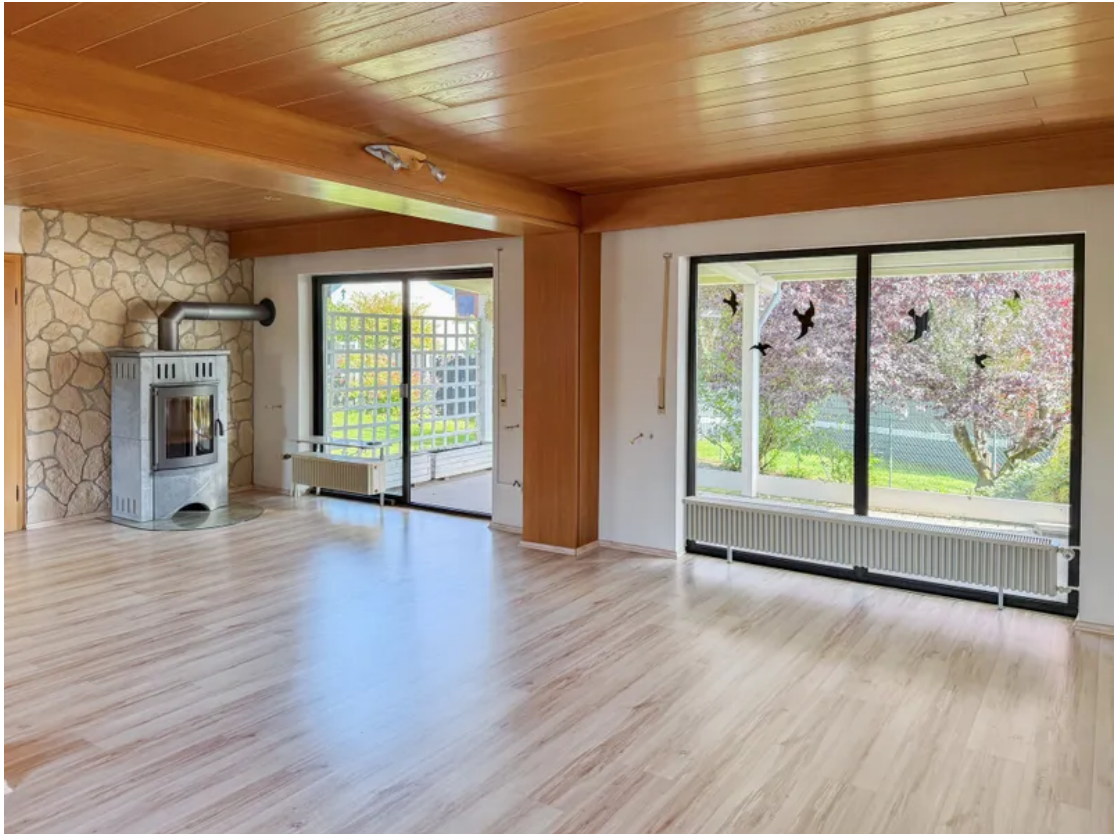
Schöner Blick in den Garten